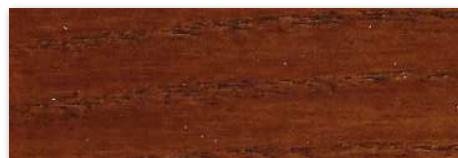
Wood Decor ( Mate ) | W20