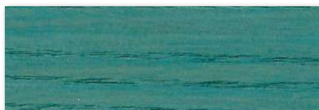
W24 Azul Turquesa