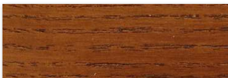
Wood Protector ( Acetinado ) | W20