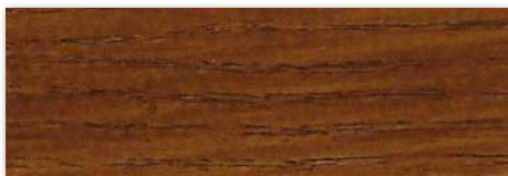
W14 Nogueira Moscada