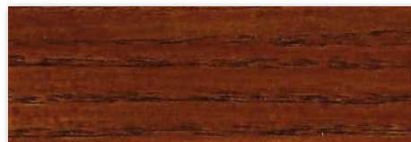
W20 Mogno Brasileiro