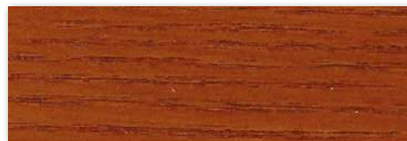
W18 Cedro Vermelho