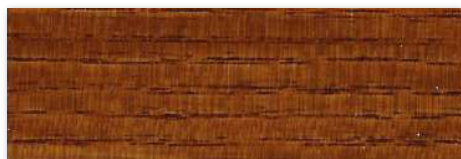
Dissolcor ( Acetinado ) | W20