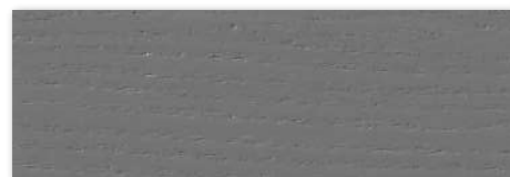
W36 Cinzento Escuro